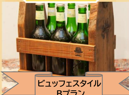
ビュッフェスタイル Bプラン

スモークサーモンと小海老のムース ほうれん草若鶏のパテ ジュレ添え 合鴨のスモーク メランジェサラダ 白身魚のポワレ トマトソース 若鶏の香草焼き ソースオリエンタル 豚ヒレ肉のパテ ミラノ風 五目チャーハン プチガトー・コーヒー