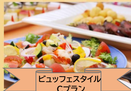
ビュッフェスタイル Cプラン

真蛸と小海老香草マリネ プロシュートのフルーツゼリー寄せ カマンベールとサーモンサラダ お造り 甘鯛のポワレ バンブランソース 牛ロースステーキ パリジャンポテト添え ちらし寿司 プチガトー・コーヒー