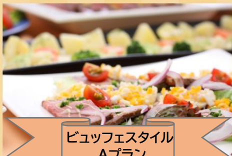
ビュッフェスタイル Aプラン